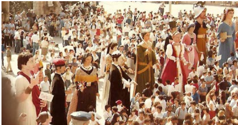
Imatge de la pujada dels gegants de la ciutat de Barcelona al 1995.

Els primers gegants que tenim documentats que es passegen per l'Abadia els trobem a La Vanguardia del 14 de setembre de 1919 amb motiu de la nativitat de la Mare de Déu: «Las fiestas profanas fueron animadísimas. La víspera recorrió el Monasterio una comitiva de gigantes y cabezudos precedidos de la popular copla de tamboriles. El domingo hizo su entrada triunfal Patufet. Por la noche, lució espléndida iluminación el monumento á la inmaculada, disparandose un lindo ramillete de fuegos artificiales». Els gegants més propers al monestir en aquells moments eren els del carrer de Viserta de Monistrol, que es van estrenar l'any 1913.