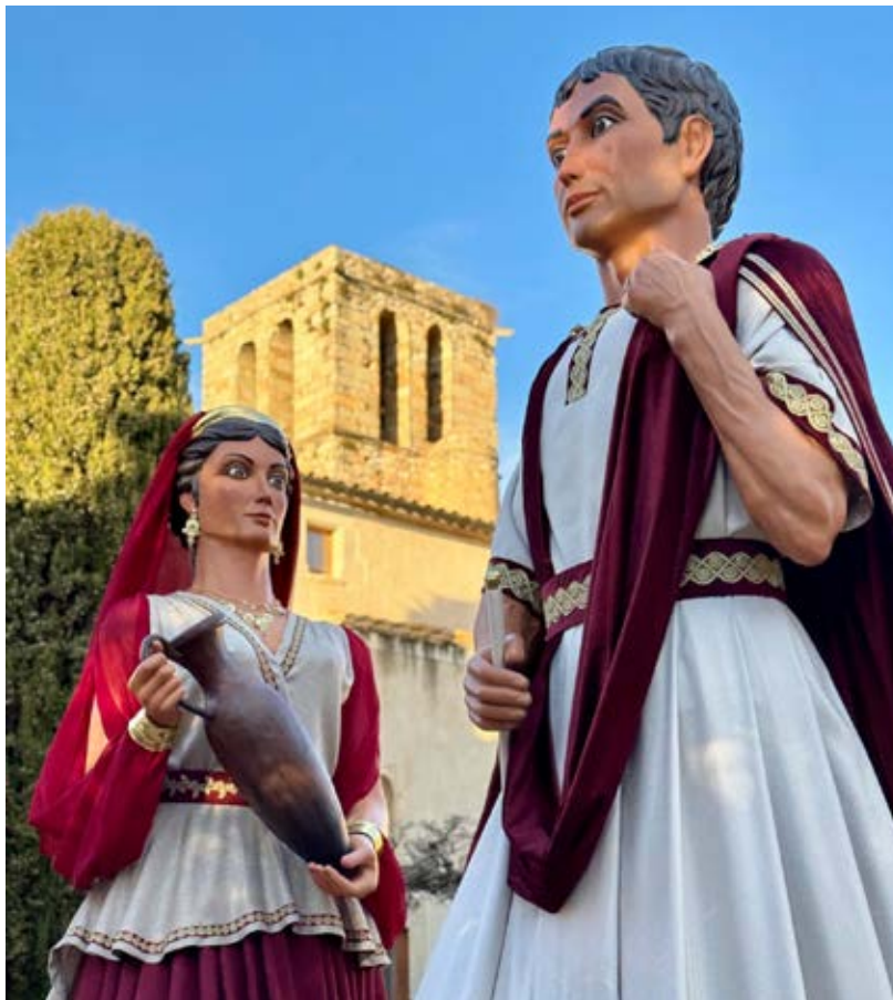
Els gegants nous lluint els seus nous vestits i restauració.

El camí cap al 2025 ja ha deixat moments inoblidables que han marcat la història del poble. Cada passa feta fins ara ha estat plena d'emoció, donant vida i personalitat a aquest projecte tan especial. Alguns dels moments més destacats fins ara han estat la presentació de la línia gràfica, el convit d'honor dels Gegants de Catalunya, la presentació dels Gegantons, en Grau i la Mel, la presentació dels