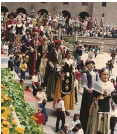
Imatge de la trobada de l'1 de maig de 1988.

entre d'altres. D'aquesta època en destaca l'anada dels gegants de la Ciutat a peu des de Barcelona l'any 1995. També, entre 1997 i 1999, diversos gegants de l'Anoia hi pugen des de la ciutat d'Igualada.