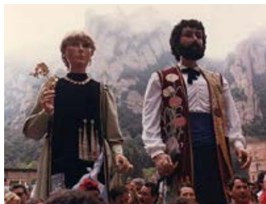
Treball i Cultura en la seva estrena.

L'any 2010 començà amb una pujada dels gegants nous d'Argentona des de Monistrol, però encara més interessant va ser la travessa que van fer els gegants de la Bauma de Berga entre Montserrat i Queralt amb més de 70 km a peu. Per aquells anys també pugen a ballar, per diversos motius, els de Sant Andreu de Llavaneres, Cervera, Cubelles, Parets del Vallès, Igualada, Sant Quirze i Sant Vicenç de Montalt, entre d'altres. El 16 de juny de 2015, els gegants d'Iluro de Mataró pugen des de Monistrol caminant i el 2013, hi ballen els gegants de l'Agrupació amb motiu del seu 25è aniversari. En