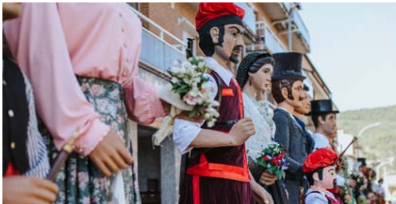
Plantada de gegants del diumenge de fira.

Cal destacar la complexa preparació d'aquesta diada, que ja va començar fa més d'un any amb la presentació de la candidatura per esdevenir seu organitzadora de la Fira, cosa que es va proclamar en la XV Fira, celebrada ara fa un any a la Ràpita. Després, la decisió de celebrar també la trobada comarcal. I després, una tasca ingent d'organització, davant la qual cal treure's el barret, i que va culminar amb la publicació del programa de la Fira, on es pot apreciar amb detall la magnitud de l'esdeveniment —i la llarga llista d'agraïments a institucions i entitats col·laboradores, així com a tots els voluntaris que hi han aportat el seu suport actiu.