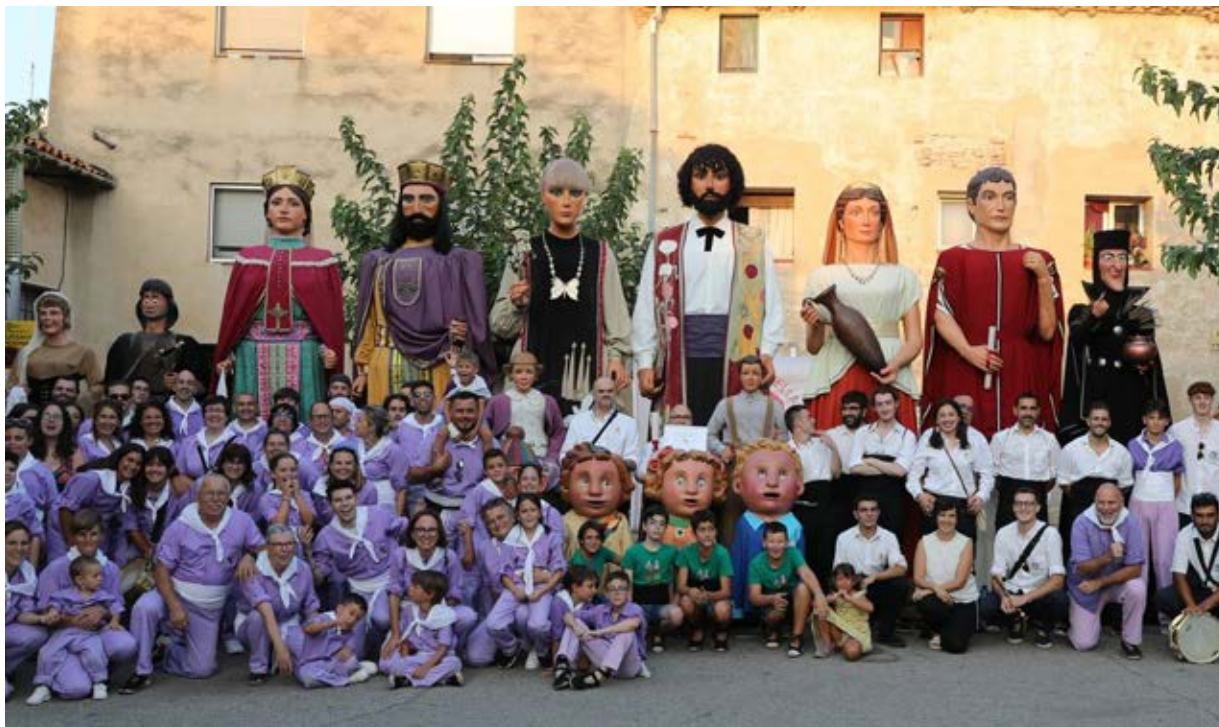
Foto de família del passat estiu.

nous vestits dels Gegants Romans... I això només és el començament! Encara queden actes i sorpreses abans de l'esperat cap de setmana del 2025, quan Caldes de Malavella es transformarà en l'epicentre de la cultura gegantera de Catalunya.