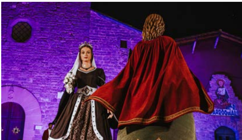
Els gegants nobles de Balsareny ballant el dia de la seva festa.