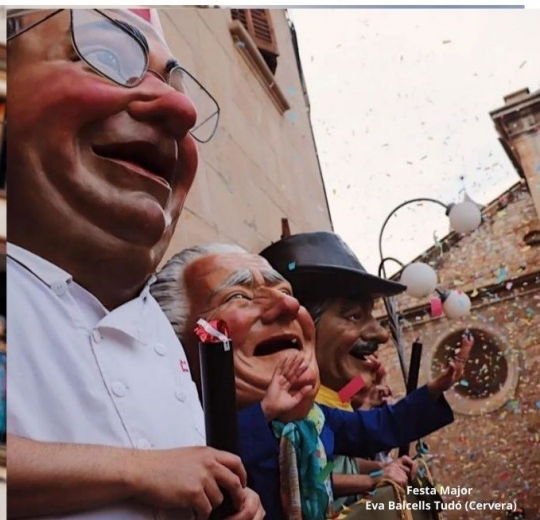
Festa Major Eva Balcells Tudó (Cervera)

El correu del concurs serà el següent: comunicacions@gegants.cat