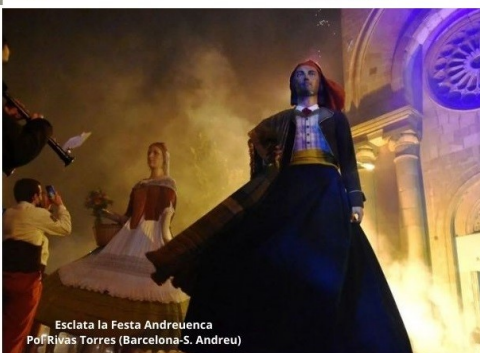
Esclata la Festa Andreuena Pd' Rivas Torres (Barcelona-S. Andreu)