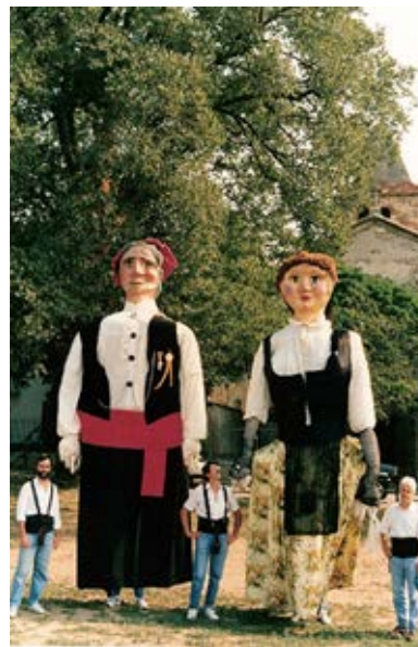
Els gegants-titelles de Sant Esteve de Palautordera són símbol d'una nova etapa en el fet geganter del país.

Tanmateix, també hi ha hagut la necessitat de recordar el fet de 1714 i la guerra de Successió a través dels gegants. El 1985 neix en Carrasquet de Reus (també amb barretina) i el 1991 la geganta reina Elisabeth-Cristina de Wolfenbüttel (Alemanya). Anys més tard, a redós dels actes del Tricentenari (2013-14), neixen gegants vinculats amb personatges de l'època a Nou Barris de Barcelona (2013 i 2014), els Prats de Rei (2013), Sant Hilari Sacalm (2014 i 2018), el Tros de Solsona (2014 i 2016) i Masllorenç (2014).