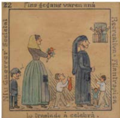
Seguici del Niu Guerrer. Vinyeta 22 de l'auca de rajoles, de final del segle XIX. Possiblement els gegants de l'antiga Societat del Born (actuals de la Casa de la Caritat).

terística, com ara els Pubills de Sallent (1978), Gràcia de Barcelona (1982), Sant Vicenç de Montalt (1986) i Santa Perpètua de Mogoda (1988), entre d'altres.