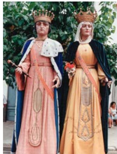
Els gegants vells d'Amposta són tota una icona dels gegants a la postguerra i l'exaltació dels Reis Catòlics. 70 anys després de la seva arribada es decideix canviar pels noms de Peronella i Ramon Berenguer IV.

Curiós cas es el de Berga o Valls, que varen mantenir l'estètica morisca, o Ripoll, on el 1945 es va permetre que els nous gegants reis prenguessin el nom de dos comtes catalans ( Guifré el Pilós i la seva esposa Guinidilda d'Empúries). En el cas