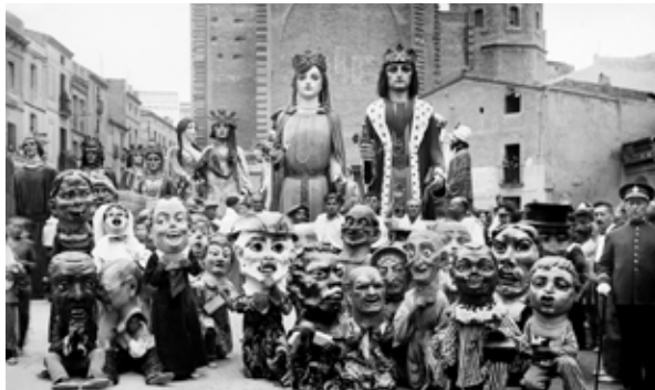
Trobada de gegants a Sabadell el 1930. Francesc Casañas. AHS.

El Concurs de Gegants, Nanos i Monstros Típics 1 fou un certamen que tingué lloc el 1902, durant les Festes de la Mercè de Barcelona, on foren convidats gegants de tot Catalunya. L'acte havia de consistir en una cavalcada el dia 25 de setembre i un festival l'endemà al Parc de la Ciutadella. Malgrat tot, a causa de la pluja, la cavalcada s'hagué de celebrar el dia 27 de setembre. 2 Hi van participar 3 els gegants de Santa Maria del Mar de Barcelona; de la Casa de la Caritat de Barcelona; una parella de Reis Catòlics de Lloquer; el nan Cu-cut del setmanari; El Cucut ; de Lleida, els gegants de la Ciutat, de la Santa Infància i de Sant Andreu; l'Àliga de la Bisbal d'Empordà juntament amb el Drac, dos gegants i sis nans; els gegants i diables de l'Arboç; els gegants i diables de la Ciutat d'Igualada; l'Àliga, el gegantó Lladrefaves i els dos gegants de Valls; els gegants, nans i trampes de Manresa; els de Sitges; els de Vic acompanyats del Cap de Llúpia; des de Berga hi van participar els gegants nous, els nans nous, l'Àliga, la Guita Grossa, el Tabal, Sant Miquel i les Maces; des de Vilafranca del Penedès hi va participar el Drac acompanyat de dimonis; de Tortosa, les dues cucaferes; els gegants de Badalona; els del Carme de Tàrraga; els de la Bonanova; d'Olot hi van participar l'Àliga de Sant Ferriol, els gegants de l'associació Sant