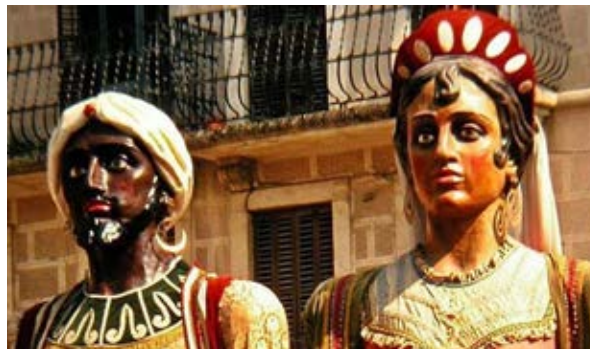
Els gegants vells d'Avinyó representen una parella mixta. A diferència d'altres parelles, en aquest cas la parella està basada en un moro i una hebrea. Arxiu Regió 7.

Un altre gegant moro amb nom el trobem a la Patum de Berga amb el de Bullafer, que també era un cabdill moro del qual se'n volia fer mofa en el seu moment. Al pla de Barcelona, la tradició mora s'ha representat a través dels gegants de les parròquies de la Bonanova i del Pi. El nom de Mustafà (el gegant del Pi) no es va oficialitzar fins a la dècada dels anys 1980, tot adoptant un amb el qual el gegant ja era conegut popularment. En la proposta d'Evarist Mora del 1960 els gegants anaven de «modo tradicional, o sea de reyes antiguos» però al 1700 ja es parla d'arreglar uns turbants pels grans. Tanmateix cal ressenyar que una de les llegendes entorn al Gegant del Pi i la seva cançó és vinculada amb la reconquesta als musulmans.