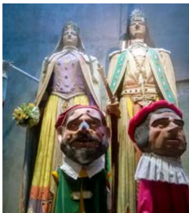
Espai expositiu dels gegants i faràndula antiga al Museu d'Història de Girona. Aquesta tipologia d'espai és considerat com a Aparador.

A casa nostra, l'any 2007 obriren les portes dues importants Cases de la Festa que marcarien aquesta modalitat d'espai patrimonial que abans comentàvem. D'una banda trobem la Casa de la Festa de Tarragona, la qual alberga tots els elements del Seguici Popular tarragoní, a més de conservar peces com els gegants i Nanos originals de l'escultor Bernat Verderol. També obrí les portes la Casa de la Patum de Berga, la qual mantenia exposada en una mateixa sala tots els elements festius de les comparses de la festa berguedana. Des de l'any 2020, però, la comparsa es troba exposada de forma indefinida en el convent de Sant Francesc.