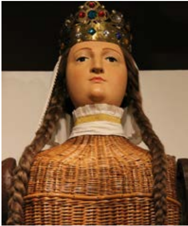
Entranyes de la geganta vella de Girona, hereva d'aquella primera geganta documentada al segle XVI.

buir de manera més o menys directa al Concili de Trento i els concilis successius, amb la sèrie de prohibicions que acaben emanant-ne al llarg dels anys. El Concili de Trento (celebrat de manera intermitent entre 1545 i 1563) suposa l'inici de la Contrareforma enfront del protestantisme i, entre moltes altres mesures, predica contra la utilització d'elements populars, festius o lúdics en les celebracions catòliques. O dit d'altra manera: gegants, bestiari i danses ja s'han deslligat massa de la seva intenció primera i han de desaparèixer de les esglésies i les processons perquè distreuen massa del missatge originari. Per bé que totes aquestes prohibicions tenen un seguiment irregular arreu del territori (perquè, en molts casos, la tradició ja es troba massa arrelada), sí que serveixen per una cosa: amb la intenció de preservar aquestes figures, confraries i gremis passen a fer-se'n càrrec cada cop