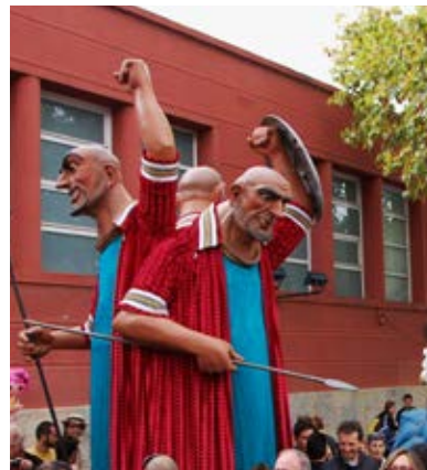
Gerió de Girona, l'any 2013.

Un altre personatge bíblic que trobem representat en alguns països d'Europa és Samsó. Concretament, n'hi ha un a Ath (Bèlgica) i tota una corrua de gegants solitaris a la vall del Lungau d'Àustria, amb peces antigues i contemporànies que representen aquest guerrer que va perdre la força en tallar-li els cabells.