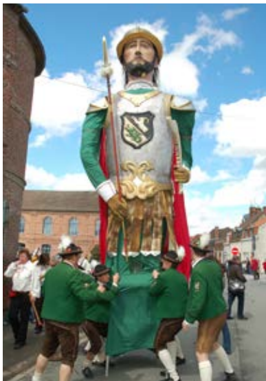
Samsó de St. Margarethen (Àustria), l'any 2012.

s'ordenà la prohibició dels gegants, àngels, sants i santes a les processons; i a Girona el bisbe Benet de Tocco va escriure queixant-se de l'escàndol que representaven els gegants, l'Àliga i Dragolins que ballaven dins l'església. Aquesta queixa encara la trobem fins el segle XVIII, senyal que no va tenir gaire èxit 5 .