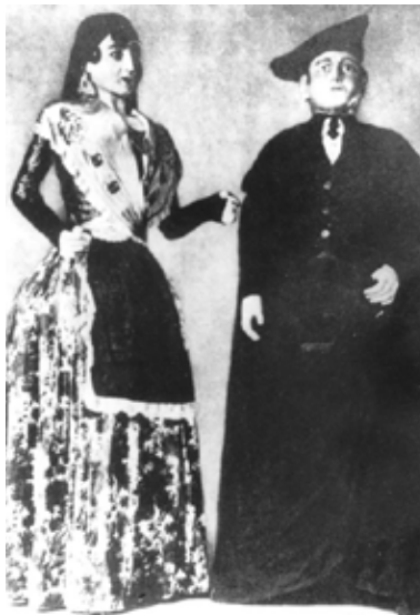
Els Pagesets de Balaguer en una imatge del segle XX. Arxiu geganters de Balaguer

Els primers gegants documentats gràficament amb barretina els trobem a Queixans (1892), Centelles (1920) i Vilanova i la Geltrú (1771, tot i que no és fins més tard que canvia el barret per una barretina). Tots aquests, d'una manera o altra, han estat recuperats i actualment segueixen ballant pels seus municipis. Els Pagesets de Balaguer (s. XIX) i els Vells de Molins de Rei (1913) continuen en actiu ara mateix. És justament en el municipi molinenc quan l'any 2012 s'organitzà una trobada de gegants amb