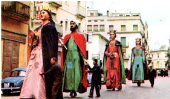
Els quatre gegants de Figueres (vells i nous) a la dècada dels anys 1970, quan el gegant anava de moro i ella de cristiana.

El mateix Grau explica que el primer gegant que podem anomenar com a moro coincideix també amb el primer que co-neixem amb nom propi, i el trobem emparellat. Apareix en el Llibre Verd de Vilafranca del Penedès , en relació a la processó de la canonització de Sant Raimon de Penyafort del 1601. En aquest llibre existeixen uns versos de Salvador Comelles que, breument, diuen així: «Jo só Ferragut sforstat / que fas tremolar lo món / sinó lo bonaventurat / que de mi ha triomfat / lo invisible Sant Ramon». De fet, Ferragut és el nom d'un cabdill moro que s'enfronta a Rotllà a Roncesvalls en la defensa de l'exèrcit de Carlemany, segons un antic poema del segle XI. En l'actualitat, tant en Ferragut com l'Elisenda de Vilafranca, els tenim reconvertits en reis cristians.