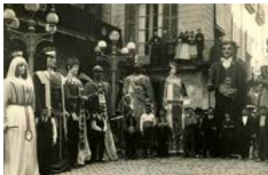
Gegants a Girona el 1925 a la plaça del Vi.

de l'any 1833. Finalment, cinc anys més tard, l'ajuntament hi posà remei encarregant la restauració de les testes i les mans a un taller olotí i unes noves vestimentes a la sastreria Casa Paquita de Barcelona. Tot i que en un principi es volia presentar la renovació de les figures el 28 d'octubre, finalment el mal temps feu posposar l'aparició i l'acte se celebrà el 30 de novembre, amb la presència dels gegants de la Bisbal d'Empordà, de Banyoles i de les Planes d'Hostoles. 4