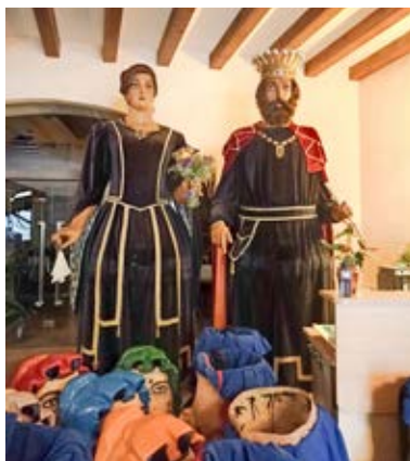
Els gegants centenaris al vestíbul de la Casa de la Vila de Montblanc en un espai que és considerat com a "Racó".

De fet, va ser en aquesta població on el 15 de novembre de 2014, s'hi dugué a terme la segona jornada del Congrés de Gegants i Imatgeria Festiva "País Gegant". Fou un cicle de xerrades sota el títol "Cases de la Festa: L'aparador del patrimoni festiu" que serví per crear un debat per tal d'estrènyer llaços entre les diverses cases i centres d'interpretacions per posar punts en comú sobre la taula. També es va crear un catàleg que recull els diversos espais expositius existents al territori, els quals es van dividir en tres classificacions: