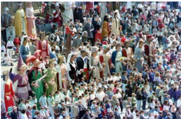
Plantada de la festa blaugrana del 1997.