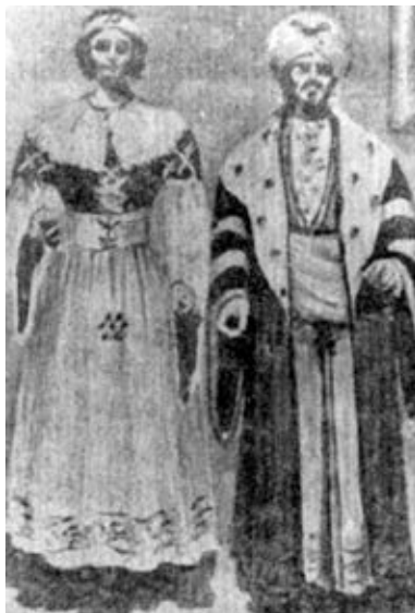
Els gegants de Vilafranca en una imatge del segle XIX quan anaven de moros

Si alguna característica té la tradició geganter del nostre país és que ha anat adoptant formes i representacions que eren importants, d'una manera o altra, per la societat de cada moment i que servien per explicar coses, fer pedagogia i, segurament, política. Moltes de les informacions que tenim sobre la imatge dels gegants és gràcies a la fotografia apareguda al segle XIX. Gràcies a això sabem, per exemple,