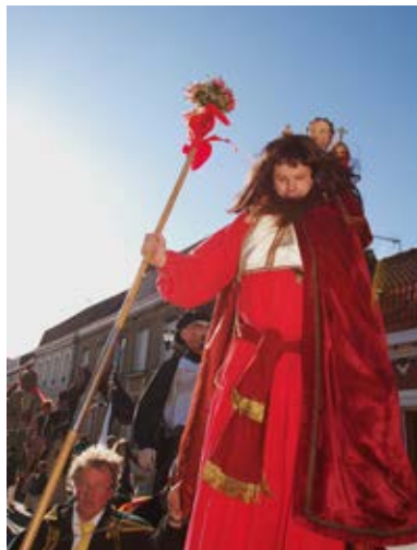
Sant Cristòfol de Flobecq, l'any 2012.

També en trobem vestigis en gegants actuals com el Sant Cristòfol de Sencelles (Mallorca) o el de l'institut Joan Ramon Benaprès de Sitges, on va ser construït per apropar els alumnes a la història dels primers gegants coneguts. També trobem gegants de Sant Cristòfol a Bergen op Zoom i Roermond (Països Baixos). Un cas a banda seria el Sant Cristòfol de Redondela (Galícia), que era transportat sobre una base de fusta, com els sants i marededéus que actualment surten en moltes processons.