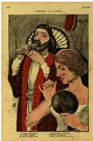
La geganta i el gegant de Barcelona preparant-se per rebre els convidats de la trobada de gegants celebrada durant les Festes de la Mercè, a la portada ¡Cu-cut! del 25 de setembre de 1902.

És en aquest context d'assimilació, transformació i evolució dels gegants processonals que comencen a aparèixer les figures de les gegantes o gegantesses; en un primer moment, segons sembla, com a companyes del gegant solitari: si