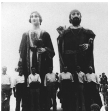
Els gegants vells de la vila de Sitges sense corones durant la segona República, cap al 1931. Anxii Blai Fontanals.

D'altres municipis van mantenir amb comptagotes les sortides de la imatgeria, amb forçat canvi d'imatge. El nou ordenament jurídic (el culte extern era qüestió de competència municipal) així com el clima social anti clerical, aturà la celebració d'aquelles festes de caire religiós,