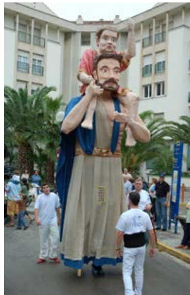
Sant Cristòfol de Sitges, l'any 2006.

A poc a poc els entremesos van anar guanyant protagonisme en la processó i també van participar cada cop més en altres activitats, com per exemple rebudes reials. L'any 1564, a l'entrada del rei Felip II a la ciutat de Barcelona, hi trobem: «Corders, ab son jegant y sert entrames» 3 . El Concili