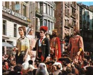
Els Pubills de Manresa a l'estrena de l'Hereu acompanyat pels reis manresans i els de la Ciutat de Barcelona.

Cal dir que la burgesia catalana també ha estat representada en els gegants a través del barret de copa alta. El Rodanxó de la Casa la Caritat (1860), tot i lluir barretina en un inici, en l'actualitat mostra un gran barret de copa alta igual que l'Hereu, el gegant nou (1918). Els que també el llueixen són els de Cubelles (1958), Sant Celoni (1963), Sant Feliu de Codines (1955) i Granollers (1963). En aquests dos últims casos anteriorment ja es passejaven pel territori llogats des de la Casa Closa de Sabadell. Més recentment han nascut altres figures amb aquesta carac-