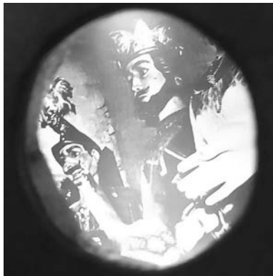
L'antic quarto dels gegants de Solsona es va convertir, l'any 2012, en un espai museístic és a dir, una Casa de la Festa. Fins aleshores les figures es podien veure a ravés d'un petit forat de la porta des del carrer Sant Llorenç.

Per cercar l'origen d'aquests museus folklòrics, ens hem de remuntar cap a finals del segle XVI, quan trobem una de les primeres referències del lloc on descansaven els gegants a la ciutat de Girona, on l'any 1593 hi ha documentat un armari per tancar «lo Jagant y Jagantesa». També a Vilanova i la Geltrú hi existia, almenys des de 1753, la «Cassa dels jigans». Tradicionalment era habitual que els gegants es guardessin a l'interior de les esglésies, donades les seves característiques força idònies per aquests elements. Uns dels exemples més clars els trobem a la basílica de Santa Maria del Pi de Barcelona o a la Catedral de Santiago de Compostel·la, espais on encara avui s'hi guarden. També era força comú guardar els elements festius a les seus de les confraries. En aquest sentit, trobaríem exemples com la «Botiga del Drac»