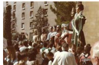
Gegants a Montserrat al 1983.

Amb motiu del centenari dels gegants morros, la ciutat de Tarragona organitzà una trobada commemorativa el 24 de setembre de 1951, aplegant una bona colla de gegants de les contrades: Amposta, l'Arboç, l'Espluga de Francolí, Falset, Móra la Nova, Valls, el Vendrell, Vilanova i la Geltrú, les dues parelles centenàries de Montbrí del Camp, Reus, Santa Coloma de Queralt, Montblanc, Cambrils, els gegants del Cós del Bou, la parella de Negritos de la ciutat, els nans de l'ermita de la Salut i els gegants amfitrions. L'acte finalitzà a la plaça de toros. Com a curiositat,