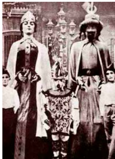
Els antics gegants de Moià acompanyats del Pollo a principis del segle XX. Ell de moro i ella de cristiana.

Els actuals moros de Tortosa i els de Lleida arribaren durant el segle XX sense cap referència anterior coneguda. D'altra banda, gegants com els de Reus (en aquest cas dins d'un context de representació de races del món) i Tarragona, han anat mantenint la seva imatge mora al llarg dels anys. Amades vincula aquesta moda en la guerra d'Àfrica finalitzada vers el 1860 en el qual l'estat en quedà vencedor.