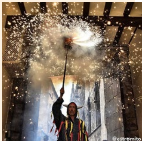
Foto guanyadora del concurs d'Instagram 2022.