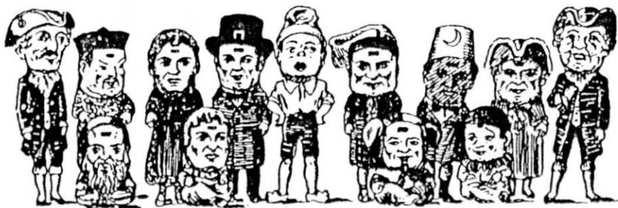
Els nans de Mataró (1951).