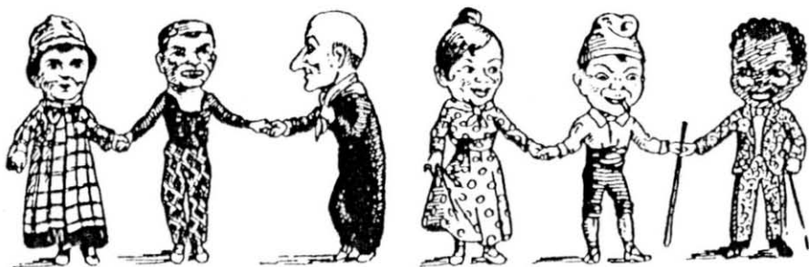
Els nans de Cervera (1930) i els de Manlleu (1950).