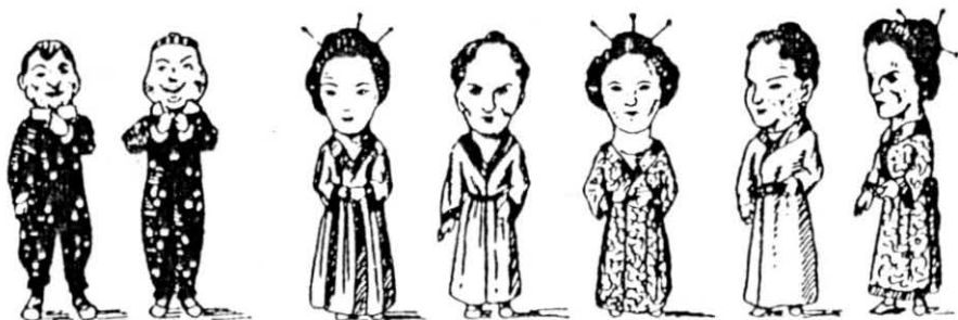
Els nans d'Igualada (1930) i els de Lleida (1932)