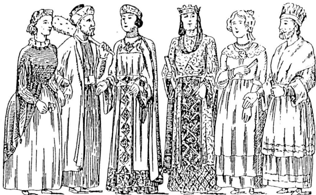
Els gegants d'Agramunt (1908), els d'Amer (1912) i els d'Arenys de Mar (1906) (1).