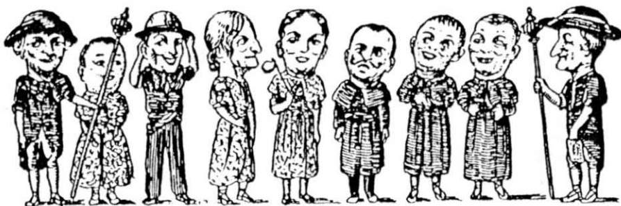
Els nans de Vilanova i La Geltrú (1951).