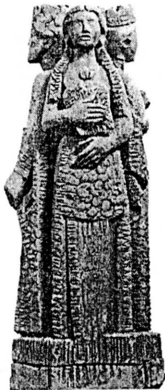
Monumnet als Gegants TONA Ciutat Gegantera 86